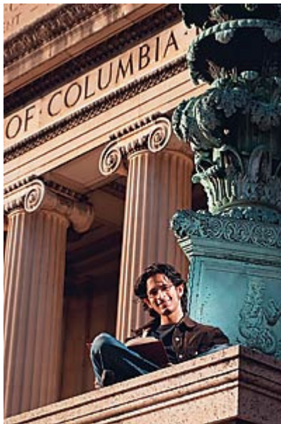
York, onde estuda hoje